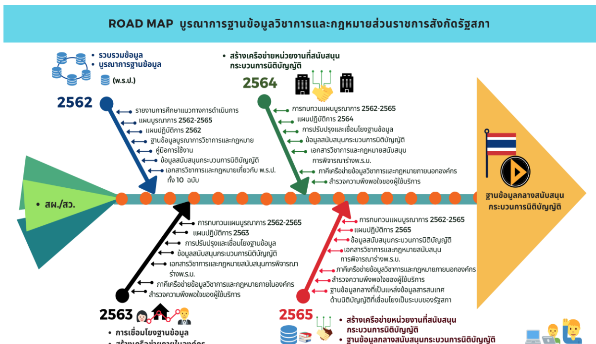
ภาพที่ ๒ Roadmap แผนบูรณาการฐานข้อมูลวิชาการและกฎหมายของส่วนราชการสังกัดรัฐสภา พ.ศ. ๒๕๖๒ - ๒๕๖๕ (ฉบับปรับปรุง พ.ศ. ๒๕๖๕)

การจัดทำแผนบูรณาการฐานข้อมูลวิชาการและกฎหมายของส่วนราชการสังกัดรัฐสภา พ.ศ. ๒๕๖๒ – ๒๕๖๕ ได้กำหนด Roadmap ของการพัฒนา โดยให้มีช่วงระยะเวลาสอดคล้องกับแผนพัฒนา Digital Parliament ของรัฐสภา ระยะ ๕ ปี พ.ศ. ๒๕๖๑ – ๒๕๖๕ ฉบับปรับปรุง พ.ศ. ๒๕๖๓ รายละเอียดดังนี้